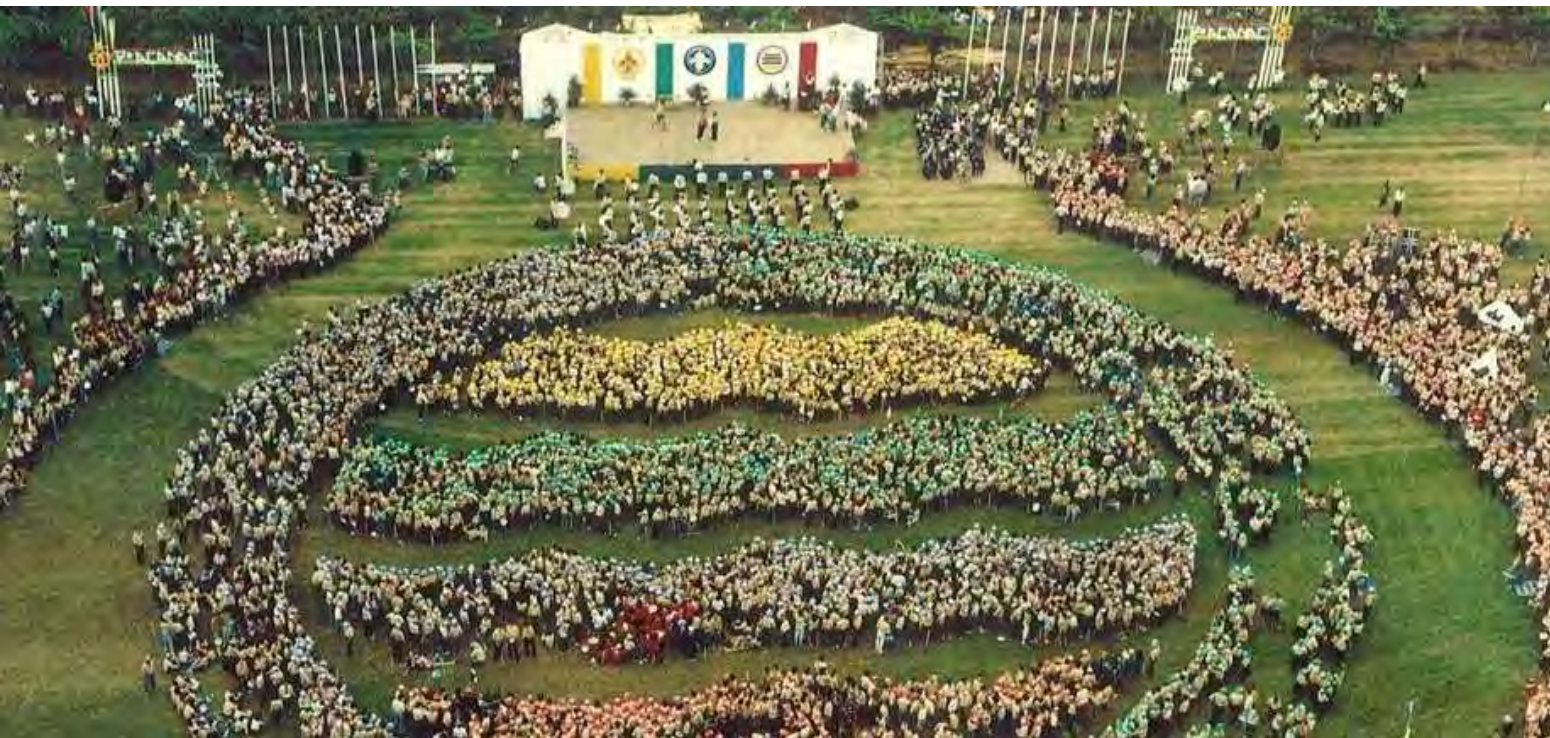
FOTO Dir. – Jogos da Amizade, antiga Pr. de Touros da Póvoa de Varzim, set. 1990 FOTO Esq. – XVII Acampamento Nacional, Bagunte, 1987

Ação da JN Cego do Maio - 2024/2025, extraída da “Estratégia 2023-2027 – Núcleo Cego do Maio”, Plano Trienal 2024-2027, ponto 4.1., pág. 8