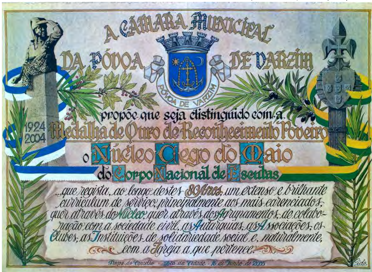
FOTO Dir. – Diploma Municipal – Medalha de Ouro da Cidade da Póvoa de Varzim, ano 2005 [80º Aniversário da Fundação do Núcleo Cego do Maio]