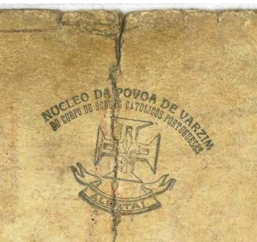
FOTO Dir. – Verso do Cartão de Filiação do CSCP / Cego do Maio FOTO Esq. – Alcateia 3 junto da Estátua Patrono, anos 40

Convidamos todos, para o caminho! Boa Caça!