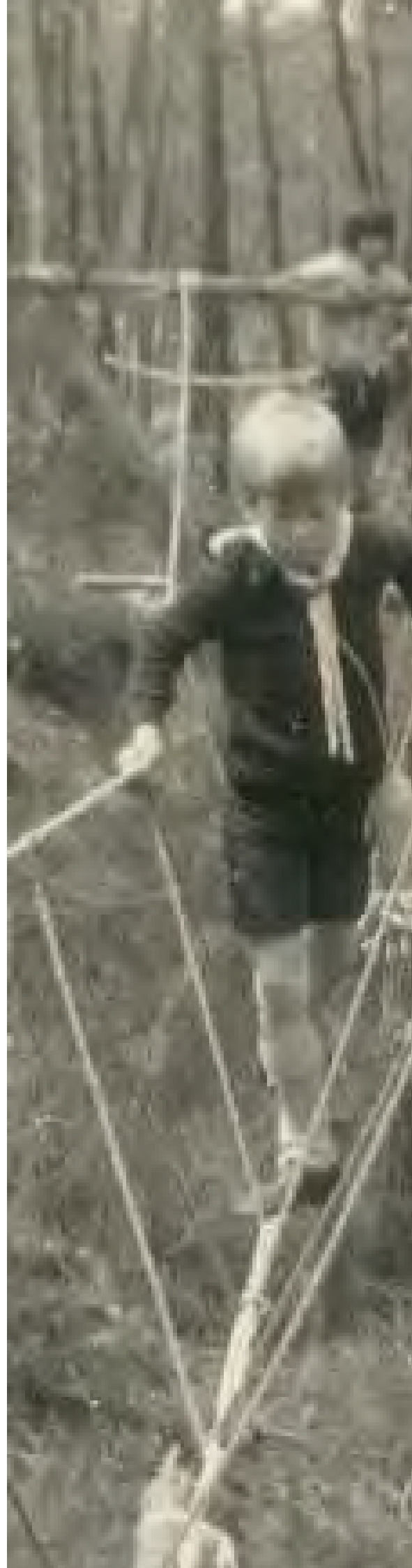
FOTO Dir. – Ponte Himalaia em Acampamento no Núcleo Cego do Maio, anos 70

Edif, Póvoa 7, nº 68, R. Almirante Reis 4490-463 Póvoa de Varzim