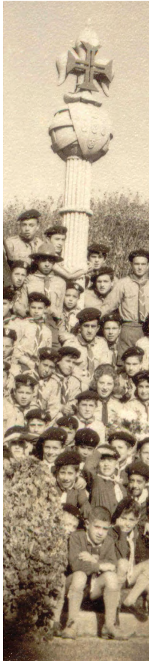
FOTO Dir. – Escuteiros do Núcleo Cego do Maio junto do Monumento da Independência de Portugal, anos 60

Viva o CNE! Viva o Núcleo Cego do Maio! 100 anos de Escutismo.